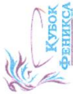
ТАБЛИЦА ИГР ПОЛУФИНАЛ «КУБОК ФЕНИКСА» среди команд мальчиков 2012 г.р. сезона 2022-23